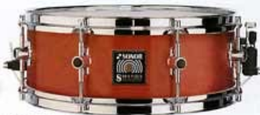
SD II 1405, Cherry Red