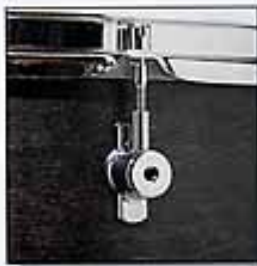
Das Spannböckchen mit Innengewinde für SAM-System Tension lugs with additional threads for the SAM system Coquilles filetés Los tensores con filete adicional para el sistema SAM