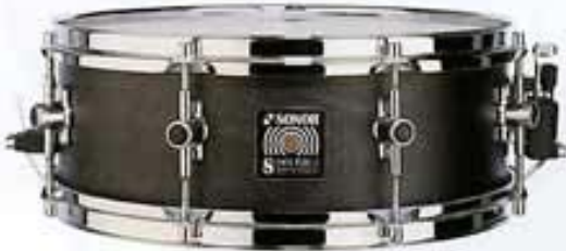
SD II 1405, Midnight Black