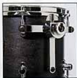
T.I.M. - T-Bar Isolation Mount