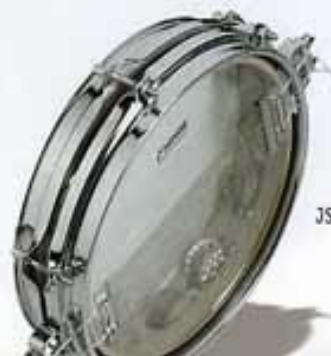
JSD II 1002, Jungle Snare Drum