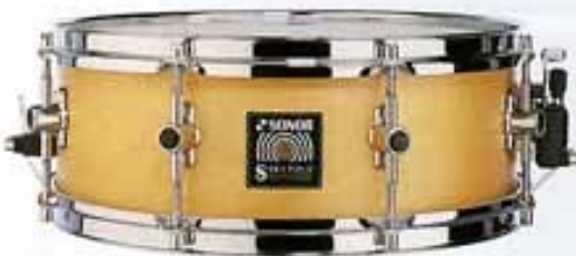
SD II 1405, Natural