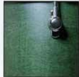
WEG Emerald Green