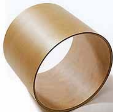
Der neue Maple-Mahagoni-Maple Kessel New maple-mahogany-maple drum shell Nouveau fût en Erable-Acajou-Erable El nuevo casco de arce-cooba-arce

The new Sonic Plus II shells feature nine ply's, comprised of 3 layers each of Maple-Mahogany-Maple. The T.I.M., (T-Bar Isolation Mount system), a value added feature from the S Class series, allows the player to experience uninhibited resonance with rich full projection. Other features included in the Sonic Plus II are: Sonor-Unicorn heads made by Remo U.S.A.; SAM system exterior threaded lugs, (hidden when not in use by black nylon resin cover), offer the player a sleek variety of options with respect to mounting accessories such as: microphones, cymbal arms, small percussion accessories, and more. Bass drum spurs and floor tom legs are attached by the SAM system and mount to eliminate invasive and excessive drilling, thereby maximizing shell integrity and enhancing resonance and total sonic quality. New tom holders offering endless adjustment flexibility; Floor tom legs with memory clamps for added stability; A rich new hand rubbed wax finish has been applied in Natural, Emerald Green, Midnight Black and Cherry Red finishes, making Sonic Plus II the set to play, hear and see.