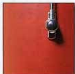
WCR Cherry Red