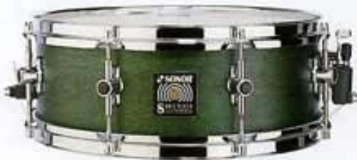
SD II 1405, Emerald Green