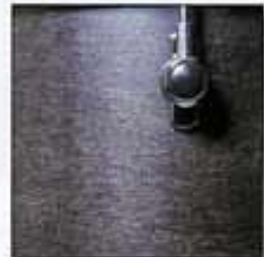
WMB Midnight Black