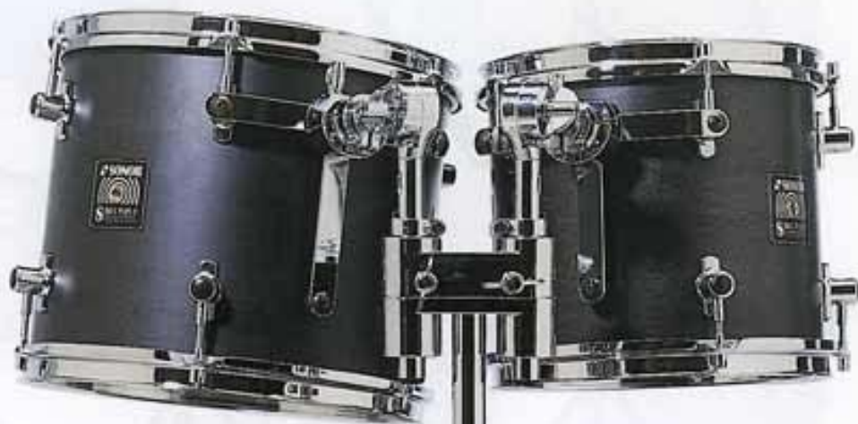
Das neue Haltegelenk The new tom holder Attache double-toms El nuevo stand de timbal