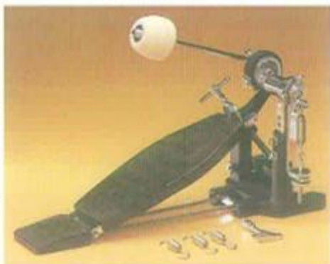
Fußmaschine HLZ 5300