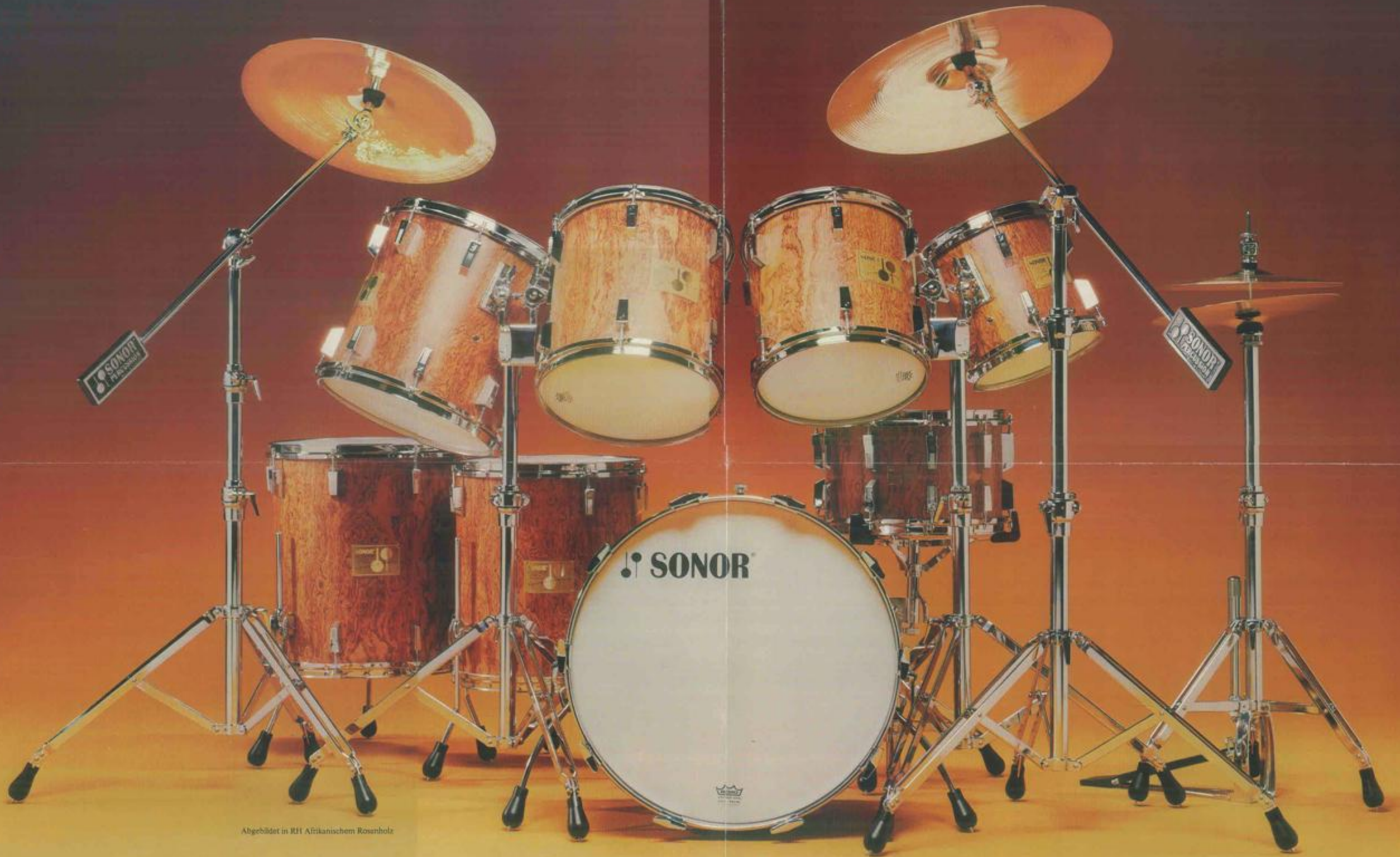
Abgebildet in RH Afrikanischem Rosenholz