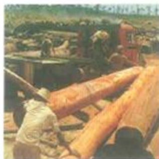
Auswahl der Rosenholzstämm in Kamerun

D as Herz dieser neuen Schlagzeugserie sind die Trommelkessel. Unser Gedanke war es, Holzkessel herzustellen, deren Klang alles bisherige übertrifft. Wir haben viele Versuche mit verschiedenen Materialien und Kesselgrößen gemacht bis wir das Optimum an Klang erreicht hatten. Unsere Wahl fiel dabei auf zwei exotische Holzarten, die noch nie vorher zur Herstellung von Trommelkesseln verwendet wurden: Indonesisches Makassar Ebenholz und Afrikanisches Rosenholz. Das Afrikanische Rosenholz kommt aus Kamerun, wo Experten unter hunderten von Baumstämmen diejenigen aussuchen, die in Struktur und Maserung als Klangholz am besten geeignet sind. Makassar Ebenholz ist eine der exklusivsten Holzarten und wird nur selten beim Bau von Musikinstrumenten verwendet; z. B. als Griffbrett für hochqualitative Celli. Zum ersten Mal in der Geschichte der Percussion stellen wir jetzt Trommeln mit echtem Ebenholz furnier her.