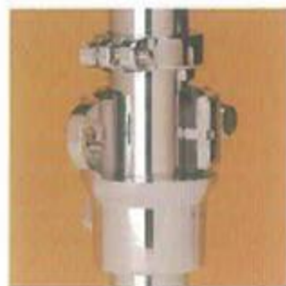
Klemmschellen an Ständern