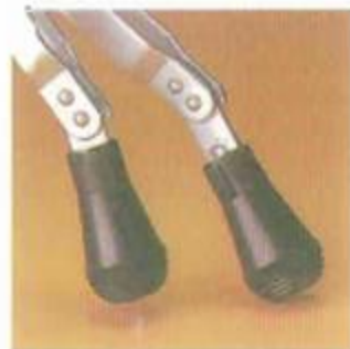
Spitzen mit Schnellumstellung