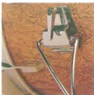
Prismenklemmung an Bass Drum

Bei der Konstruktion einer neuen Fußmaschine konnten wir alle Erfahrungen, die wir bisher auf diesem Gebiet gesammelt hatten, zusammenfassen. Herausgekommen ist dabei eine Einsäulenmaschine mit doppelter Kugellagerung und größtmöglicher Repe- tiergeschwindigkeit durch exzentrischen Bewegungsablauf. Der Fußtritt wurde mit einem spezialentwickelten, rutschfesten Gummibelag ausgestattet. Ohne kompliziert zu sein bietet diese Fußmaschine alle denkbaren Einstellmöglichkeiten.