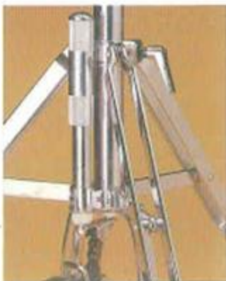
Schraubhülse und Rollenkette an Hi-Hat