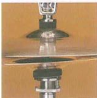
Oberer Beckenhalter und Schräg- steller an Hi-Hat